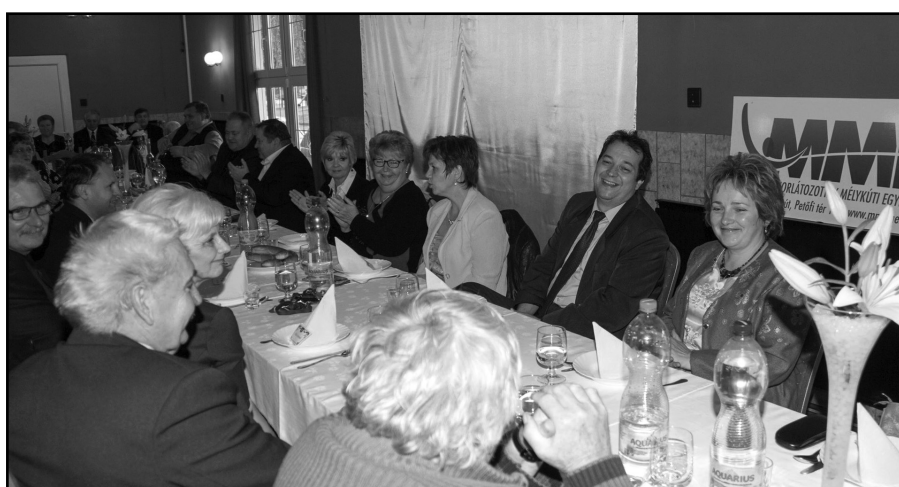
Őszi Kulturális Nap